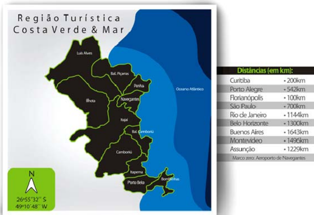
Figura 1- Mapa Costa Verde & Mar

A região turística Costa Verde & Mar é formada pelos Municípios de Balneário Camboriú, Balneário Piçarras, Bombinhas, Camboriú, Ilhota, Itajaí, Itapema, Luís Alves, Navegantes, Penha e Porto Belo.